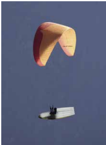
Mit innovativen Gurtzeugen gleiten unsere Piloten effizient durch die Berge.