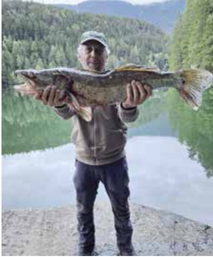
Anglerglück am Piburger See

Industrieboden verlegt werden, der als Grundlage für die künftigen Einsatzfahrzeuge und Arbeitsbereiche dient.