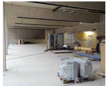
Baufortschritt beim neuen Einsatzzentrum Oetz