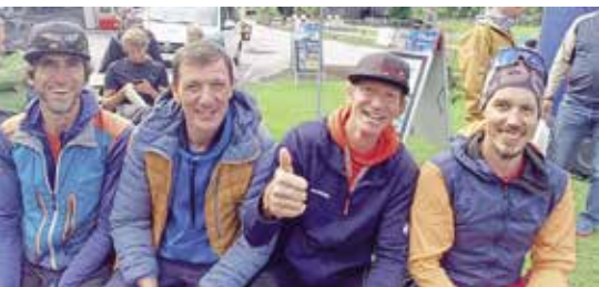
Vier motivierte Piloten vertraten das Ötztal beim Wanderbird Hike & Fly im Stubai.