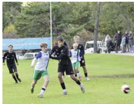
Infight bei der U14