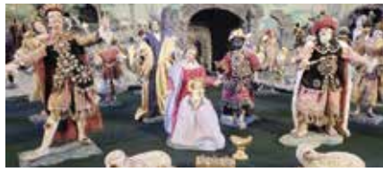
Informationstafel Burgruine Auenstein