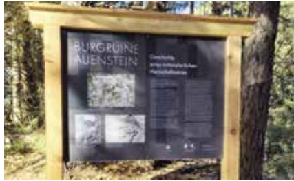
Hl. Familie mit den Hl. Drei Königen aus der Kirchenrippe