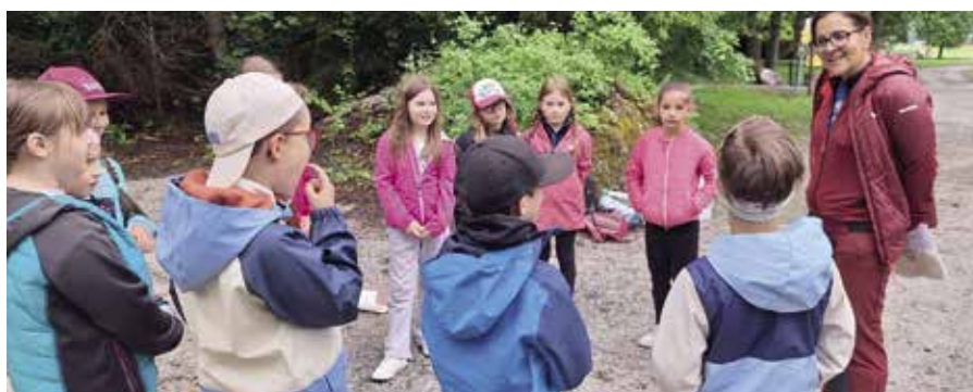
Naturpark Ötztal. Unser Boden – i steh auf di