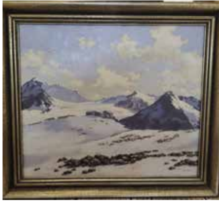
Ankauf, Braunschweigerhütte, Ölmalerei