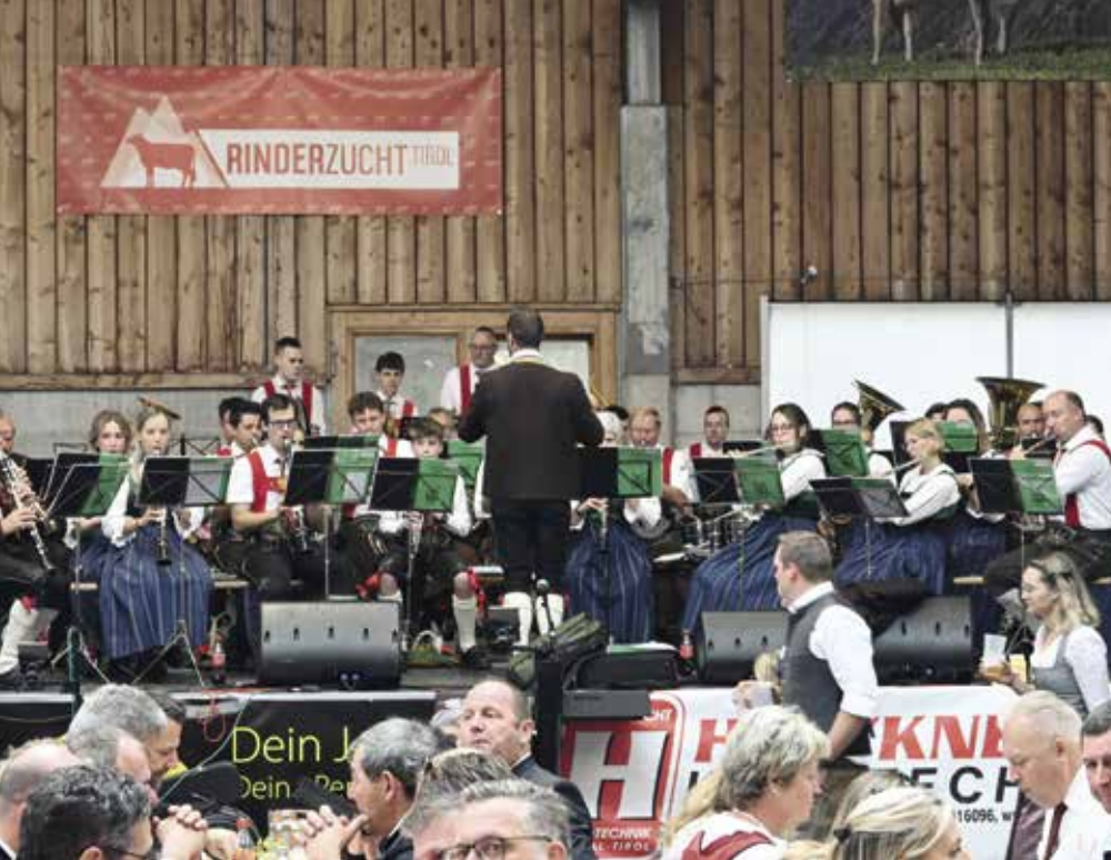
Die Musikkapelle Oetz war beim Bezirkserntedank in Imst im Einsatz