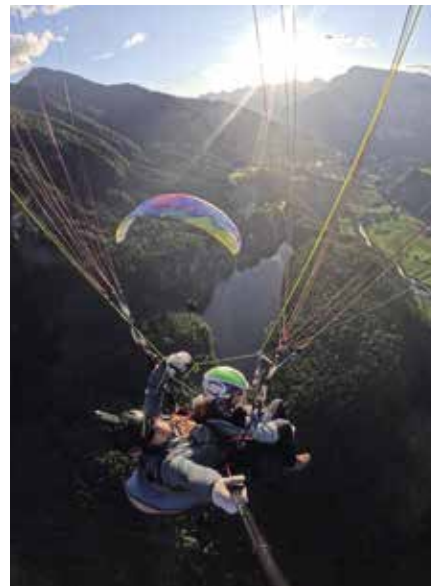
Traumhafte Stimmung während der beliebten Abendfahrten.