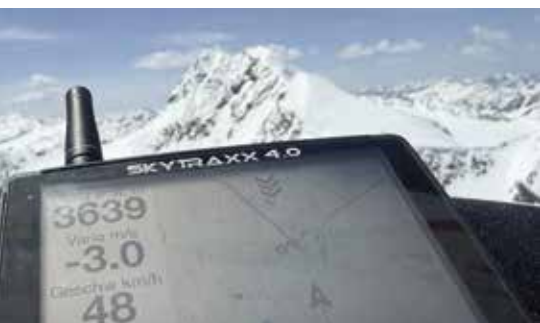
Auf über 3.600 Metern Höhe – der Blick Richtung Wildspitze bleibt unvergesslich.