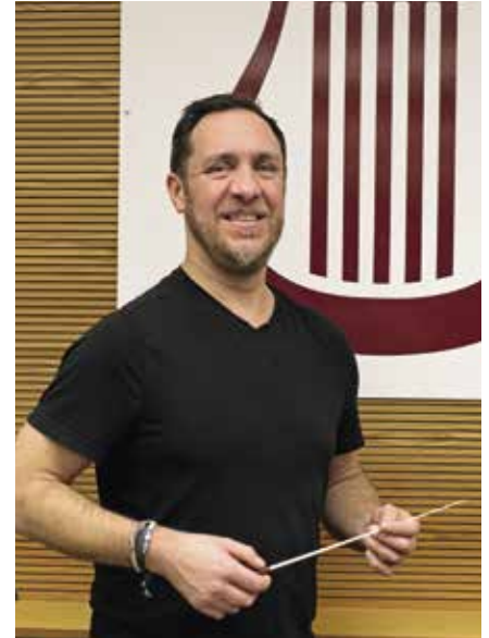
Unser Kapellmeister war in Mailand erfolgreich